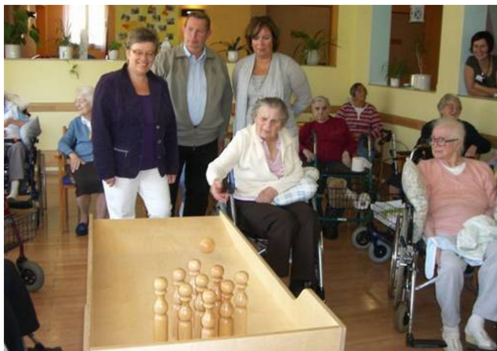
Übergabe der Kegelbahn im September 2009 an die Bewohner des Seniorenheimes FAZIT in der Franz-Ludwig-Straße.