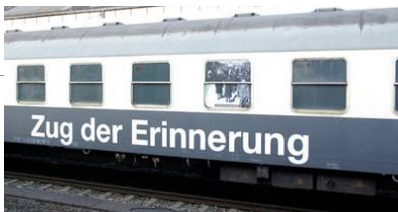
„Zug der Erinnerung“ - dafür spendeten wir 500,00 Euro

Der Bürgerverein spendet den Gewinn, der durch großes Engagement vieler ehrenamtlich Tätiger möglich wird, an gemeinnützige Institutionen, vorzugsweise im Bamberger Inselfeld. Im abgelaufenen Jahr konnten wir die Arbeit folgender Einrichtungen und Vereine mit einem Gesamtbetrag von weit über 10.000 Euro unterstützen: