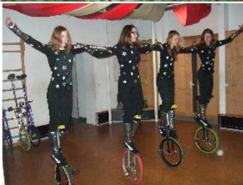
Bild links: Vorführung des Zirkus Giovanni bei unserer Weihnachtsfeier