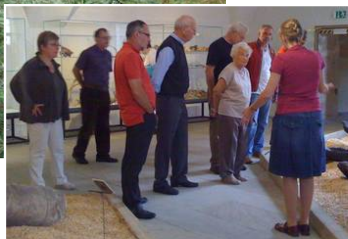
Bild unten: Führung im Historischen Museum zum Thema „Lebensader Regnitz“