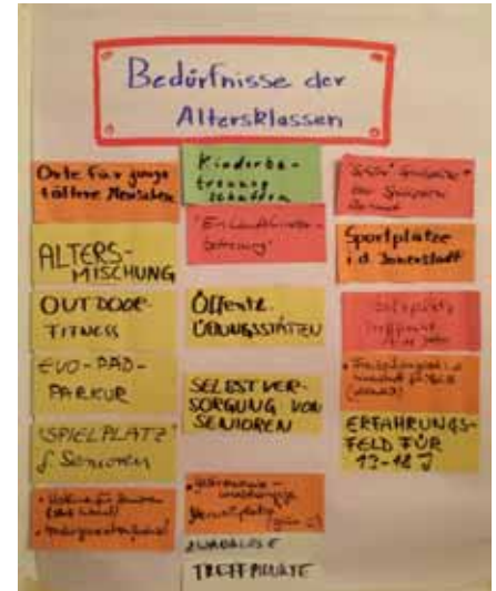
Beim Arbeitstreffen

Von diesen Überlegungen getragen und gleichzeitig von der verbreiteten Einschätzung getrieben, wonach gerade die Entwicklung der Bamberger Innenstadt eine gewisse Ausgewogenheit der Interessen oder auch das Ergreifen von Entwicklungschancen vermissen lässt, hat der Verfasser im März dieses Jahres den Arbeitskreis „Le-