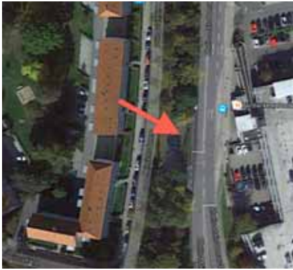
Vorschlag: zusätzliche Bedarfshaltestelle am P+R-Platz Alter Plärrer/ Heinrichsdamm

gebenheiten im Haingebiet (Nähe zur Innenstadt, ebene, gut mit dem Fahrrad zu nehmende Strecken) nicht allzu groß. Der Vorschlag zur Taktausdehnung von halbstündlich auf stündlich ist somit nachvollziehbar.