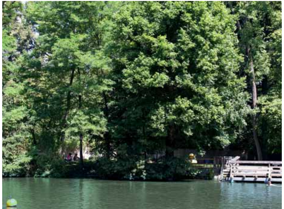
Versteckt hinter Bäumen: Die „Heilige Wiese“

Orte des Genusses sind kostbar. Sorgenfalten beginnen sich zu glätten, ein Glitzern in den Augen blitzt auf. Beim Gedanken an unser Hainbad macht sich Vorfreude breit: „Ich bin beglückt über meine Hainbadfreunde... Ist der aufblasbare Delphin regnitzgeeignet?... Omas Liegestuhl taugt für die Heilige Wiese... Das Anhängen an die Bojen ist Wassergymnastik ohne Selbstbeteiligung! ... Den Strohhut aus der Provence lass ich heuer in meiner Kabine! ... Mit Gerd Wassergymnastik machen – ein Traum! ... Der Blick auf die Concordia und den Vierzehnheiligenpavillon ist durch nichts zu ersetzen... Dieters Bier ist sooo lecker!“