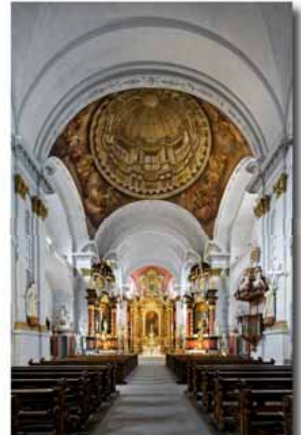
Hochaltar nach der Renovierung