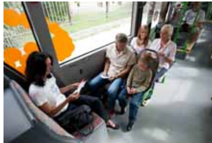
Weiterhin bequem mit dem Bus durch den Hain

Stadtauswärts fährt die Linie 928 über die Hainstraße, die Ottostraße und die Schützenstraße auf den Heinrichsdamm. An der Claviusstraße biegt der Bus dann rechts in den Rhein-Main-Donau-Damm und von dort in den Münchner Ring ab. Stadteinwärts fährt der Bus vom Münchner Ring in den Rhein-Main-Donau-Damm, biegt links in die Ottostraße ab und fährt schließlich über die Hainstraße zum