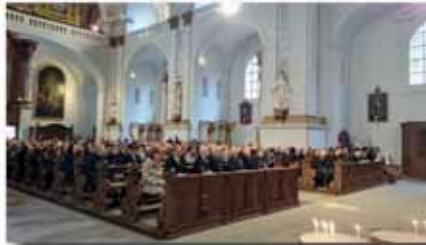
Gottesdienst in neuem Glanz