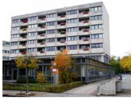
Herold-Gebäude von der Ottostraße aus

Der Mangel an Wohnraum zu erschwinglichen Preisen in Bamberg ist dramatisch bei immer noch steigender Tendenz. Bisher standen in der Schützenstraße 23 etwa dreißig Wohnungen in bester Lage zur Verfügung. Durch die geplante Umnutzung des Großteils in Hotelzimmer und Ferienwohnungen wird der bereits jetzt vollkommen überspannte Wohnungsmarkt erneut stark und ohne