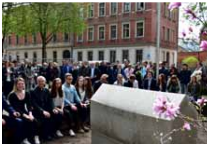
Einweihung des Erinnerungsortes

Im April 2016 wurde der neue „Erinnerungsort“ im Vorhof des Franz-Ludwig-Gymnasiums eingeweiht. Der BV Mitte hat das Projekt mit einem größeren Spendenbetrag unterstützt.