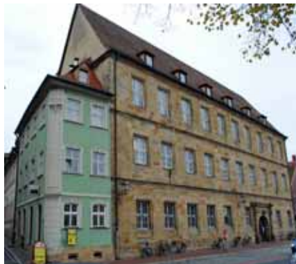
Hochzeitshaus und Haus zu der Krausen

Man sollte hier am Kranen aber auch innehalten, um den Blick über die Altstadt zu genießen. Von hier aus kann man vier Kirchen sehen: die Domtürme und Obere Pfarre, das Kloster Michael und St. Stephan. Gleichzeitig befindet sich hier das alte Bamberger Schlachthaus, das mit Sandsteinquaderbau und Untergeschoßarkaden in die Regnitz hinausgebaut wurde. Der