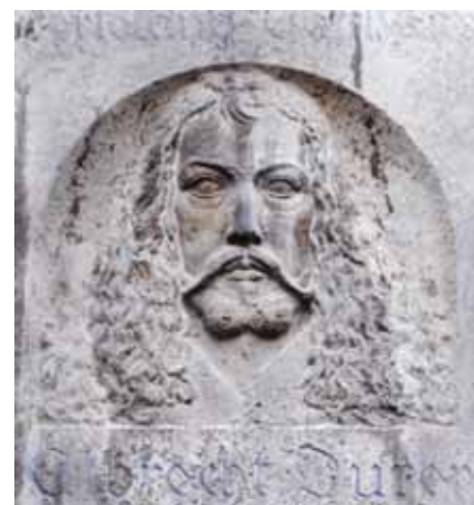
Prominenter Besuch in der Austraße 17: Hier wohnte wiederholt Albrecht Dürer

Die Fischstraße 9 ist ein Anbau, das Haus zu der Krausen, bereits 1405 genannt, das zu dem heutigen Grundstück Austraße 21 gehörte. Wegen eines geplanten Straßendurchbruchs erwarb die Stadt Bamberg 1480 das Grundstück und brach 1481 das Vorderhaus in der Au völlig ab. Das Rückgebäude zur Greden wurde mit einem Schwibbogen unterfangen, durch den die neue Straße führte; es wurde auch neu unterkellert. Ab 1483 war das Haus samt Keller an Privatpersonen vermietet, 1531 bis 1591 im Besitz des Stadtbauhofes. Im Zuge der Baumaßnahmen zur Verschönerung und Verbreiterung der Fischstraße wurde es 1768 endgültig abgebrochen. Nur ein schmales