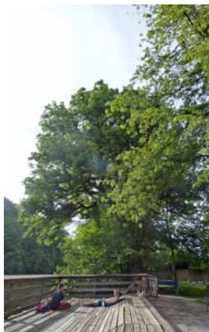
Die Alte Ulme

zer ausgetauscht, kaputte Dachflächen erneuert und nötige Renovierungen getätigt werden. Der beliebte Steg wird statisch ans Ufer gehängt und mit hochwertigem Holzbelag versehen. Im Fokus der Aufmerksamkeit für die nötige Fundamentierung der Balkonaufhängung stehen die Alten Bäume. Manche sind älter als das Hainbad selbst, schließlich ist der Hain das älteste Flora-und-Fauna-Habitat Deutschlands. Die Baumaßnahmen nehmen Rücksicht auf die 150-jährige Rotbuche, den 80-jährigen Ahorn, die über 150 Jahre alte Eiche. Auch um die 80-100 Jahre alte Ulme am Ausstieg spannt sich als eine der wenigen Ulmen im Stadtgebiet ein Schutzschirm. Die Baustellenlogistik wird jetzt über das Wasser erfolgen und die Widerlager für den Steg dem Wurzelverlauf der Bäume angepasst. So viel Sorge muss sein. So achtsam das menschliche Miteinander im Hainbad gepflegt wird, soll auch der Umgang mit dem Ort selbst erfolgen – die Interessengemeinschaft hilft dabei.