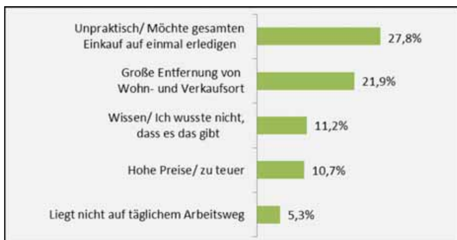
Abb. 2: TOP 5-Gründe für den Nicht-Einkauf bei den Bamberger Gärtnereien (n=100, Mehrfachnennungen möglich).

Aus den Ergebnissen lässt sich ableiten, dass gerade die Vermittlung, d.h. Bemühungen der Bewusstbarmachung des kulturellen Erbes eine zentrale zukünftige Ressource ist. Ob UNESCO-Weltkulturerbe, Traditionssorten oder Einkauf bei den Gärtnereien vor Ort – großen Teilen und gerade auch der jünge-