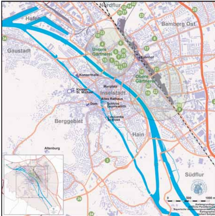
Abb. 1: Gärtnerreien in der oberen und unteren Gärtnerstadt. Kartographie: Lehrstuhl Kulturgeografie, Universität Bamberg; Sohmer

Eine Studie zur Bedeutung der Gärtnerstadt und ihrer Erzeugnisse für die Bamberger Bevölkerung