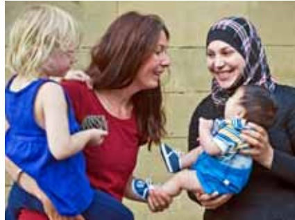
Kontakt mit einer anderen Kultur – eine Bereicherung für alle!

Seit eineinhalb Jahren gibt es bei Freund statt fremd e.V. diese durch zwei Frauen besetzte Stelle der Patenschaftskoordination für den Aufbau eines Patennetzwerkes. Viele neue Patinnen und Paten konnten im Lauf dieser Zeit gewonnen werden und stehen seither einem Asylsuchenden oder einer -familie zur Seite, schenken ihre Zeit und haben durch einen kontinuierlichen Kontakt ein gutes Vertrauensverhältnis aufgebaut.