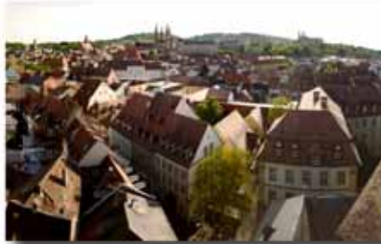
Blick vom Kirchturm

In der letzten Inselrundschau stellten wir die Renovierungsarbeiten für die Martinskirche vor und veröffentlichten einen Spendenaufruf. Im Mai erhielten wir eine teilweise spektakuläre Baustellenführung mit Architekt Johannes Sieben, bei der u.a. die Statikprobleme im Dachstuhl vor Ort erläutert wurden. Außerdem wurde uns eine der schönsten Aussichten über Bamberg vom eigentlich gesperrten Kirchturm aus ermöglicht.